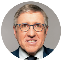
François Bausch Nohaltgkeetsminister, MDDI

„Ee rezente Sondage huef gewisen, dass am leschte Joer 60% vun de Résidents Vëlo gefuer sinn. Zesumme mat de Gemenge kenne mir grad den DICI-Raum mat senger dichter a gemëschter Siedlungsstruktur op eng flott Manéier nei erschleissen.“