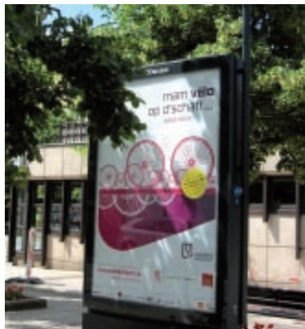
Mam Vëlo op d'Schaff - 17.05.- 16.07.2010