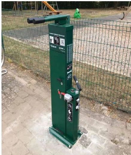
Nei Bike-Repair Statioun zu Nidderaanwen

D'Gemeng Nidderaanwen huet eng nei Statioun zu lernzen laanscht d'PC2 opgeriicht a plangt nach eng zweet Statioun um Sennengerbiërg. Och d'Gemeng Bissen ass am gaangen an a ronderëm dat aalt Barrièreshaischen "A Pafend" eng Raschtplaz fir Vëlosfuerer a Wanderer unzeleeën. Eng nei Entwécklung, déi mir als ProVelo immens begréissen well se souwuel den Alldagsvëlosverkéier wéi och d'Fräizäitsvëlosfueren ënnerstëtzen.