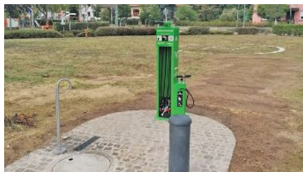
Statioun zu Konsdref

Ëmmer méi Gemengen entscheeden sech dozou d'Vëlosfueren an hiren Dierfer ze promovéieren. An de leschte Méint hunn sech vill Uertschaften, déi direkt un den nationale Vëlosweeër leien mat Bike-Repair Statiounen ausgestatt. Sou zum Beispill och d'Gemeng Konsdref déi eng néi Statioun mat enger Drénkseil laanscht d'PC 2 op der Héicht vun der aler Gare opgeriicht huet.