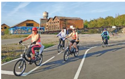
Fahrradschule in Düdelingen

Mitte September haben wir zudem in Zusammenarbeit mit der Gemeinde Düdelingen einen weiteren Kurs für Anfänger an der ehemaligen Industriebrache NeiSchmelz organisiert.