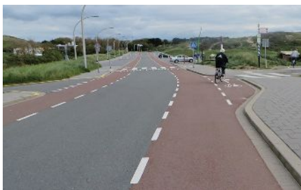
Priority Lane an Holland

Autosfuierer mat benotzt ginn, sou datt sech zwee entgéint kommend Autoen ouni Problem kräize kënnen. Am Fall wou awer aus béid Richtunge Vëloen an awer och Autoe kommen, mussen d'Autoen sech hannert de Vëloen areien a waarde bis een lwwerhuele méiglech ass. Well et sech bei der Rue des Labours ëm eng Niewestrooss handelt, mécht dës Variant definitiv Sënn. Duerch zousätzlech rout Faarf um Buedem kéint eng méi visibel Trennung vu Vëlo/ Auto erzielt ginn, wat d'Vëlosfuere méi sécher géif gestalten.