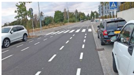
Neie Marquage an der Rue des Labours

An der Rue des Labours fannt dir säit kuerzem dës nei Andeelung vum Stroosseraum, wou de Vëlosverkéier prioritär ass! An Holland ass dës Variant scho gang und gäbe! Dës Variant baut op Angebotstreifen op. Dat heescht déi säitlech Spuere kënnen, am Fall wou kee Vëlosfuierer ënnerwee ass, vum