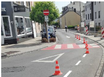
Nouveau marquage dans la rue des Romains

Le règlement de circulation temporaire permettant aux cyclistes de circuler à double sens dans la rue des Romains (tronçon «am Bechel»), a été prolongé d'une année. Afin de permettre aux cyclistes de rouler en toute sécurité à double sens, le marquage de la bande cyclable vient d'être adapté. Les arbres et plantes sur l'îlot au croisement de la rue des Romains et la rue Marguerite Thomas-Clement ont été raccourcis, afin d'avoir une vue plus dégagée sur ce croisement.