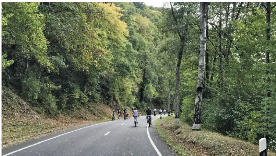
Vill Vëlosfuerer op der gespaarter Streck tëscht Méchela an Ierpeldeng

D'Europäesch Mobilitéitswoch ass dëse Sonndeg ënner anerem mam Bike4all am Waarkdall op en Enn gaangen. D'Gemeenge Feelen a Mäerzeg, hunn an Zesummenaarbecht mat de Kommissiounen fir Ëmwelt & Mobilitéit Feelen an Event & Green Mäerzeg déi zweet Editioun vum autofräien Dag mam Fokus op de Vëlo organiséiert. D'Strooss N21 gouf vu Mëttes 1 bis Owes 6 Auer tëscht Mäerzeg an Uewerfeelen gespaart. An och tëscht Uewerfeelen an Nidderfeelen war en Deel vun der Areler Strooss, der Colmer Strooss an dem Kiercheweie fir de motoriséierte Verkéier zou. Duerch déi bekannte Grënn huet dës Editioun ënnert enger vereinfachter Form stattfonnt, an awer hu vill Léit de Wee um Vëlo an de Waarkdall fonnt.