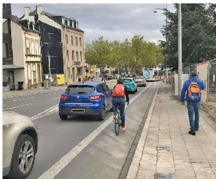
Fahrradspur in der Rue de Bonnevoie

Will man als Radfahrer aus Luxemburg Stadt in Richtung Bonneweg fahren, bieten sich einem mehrere Möglichkeiten an. GoogleMaps zumindest schickt einen nach dem Viaduc (Passerelle) über den Boulevard d'Avranches, durch die Avenue Charles de Gaulle und die Rue du Laboratoire, um dann über die Rue de Bonnevoie, entlang der Rotondes ins Zentrum von Bonneweg zu gelangen. Dies scheint auf den ersten Blick auch die schnellste und beste Verbindung zu sein, vor allem weil die Strecke zum Großteil auf Radwegen und Fahrradspuren zurückgelegt werden kann. Kennt man jedoch die Situation vor Ort, weiß man, dass es alles andere als spannend ist, sich zu den Hauptverkehrszeiten in diesem Bereich mit dem Fahrrad fortzubewegen.