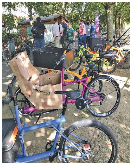
Sélection des vélos cargo exposés

Vendredi, 18 septembre toutes les institutions publiques et entreprises du Luxembourg ont été invitées à Mamer pour découvrir le potentiel des vélos de fret comme moyens de transport durable à Mamer au Parc Brill, à côté de la mairie. Les vélos cargo, avec ou sans moteur électrique, peuvent servir d'alternative intelligente pour le transport de marchandises, tout en étant peu coûteux et en même temps bénéfiques pour la santé. Différents modèles ont été présentés et puis testés sur place. Un événement qui a remporté un grand succès.