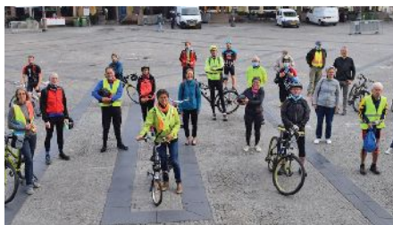
Une partie des cyclistes au Knuedler