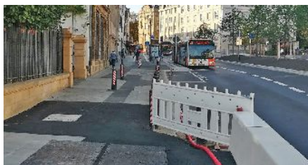
Situation am nördlichen Ende der Brücke

dass ein Einsatz dieser Trennung durchaus auch in der Avenue de la Gare Sinn machen würde. Besonders gefährlich wird der Radweg aufgrund der Bushaltestellen „Al Avenue“ (lieblos durch Farbmarkierungen umgeleitet) und „Centre F.D.Roosevelt“ (Viele Menschen schreiten schnell und gestresst vom Bus direkt auf den Fahrradweg). Auch enttäuschend ist die fehlende Radschleife für die Ampelschaltung auf der Kreuzung Avenue de la Gare- bld d'Avranches, sowie die unkomplette Absenkung des Bordsteines vor dem Radstreifen. Eine weitere Schwachstelle ist ein kurzer Abschnitt „usage mixte“ am nördlichen Ende der Brücke wo sich zudem noch massive Pfosten mitten im Weg befinden.