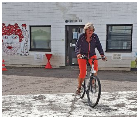
Teilnehmerin der Fahrradlehrausbildung

Seminare III und IV absolvieren, welche nur in Begleitung von Fahrradlehrenden gemacht werden können.