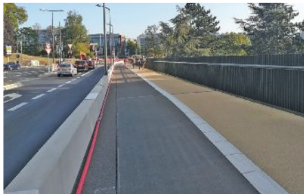
Der neue Radweg auf der "Al Bréck"

Die Strecke gilt als Testabschnitt für diese neue „Notlösung“, wobei zu sagen ist,