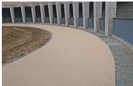
Une piste pour piétons et cyclistes

En date du 14 septembre 2020, le passage souterrain qui remplace le passage à niveau PN17 à Walferdange a été inauguré. Le projet de voirie consistait principalement en l'aménagement d'un passage inférieur (avec une piste pour piétons et cyclistes) sur le CR125 vers le "Stafelter" à la hauteur du PN17.