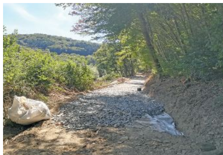
Teilstück des neuen Radweges

Seit nun mehr als 15 Jahren warten Touristen und Einwohner in und um die Ardennenhauptstadt Wiltz auf eine durchgehende Fahrradverbindung nach Kautenbach. Vom Bahnhof Wiltz bis zum Bahnhof Kautenbach sind es aktuell 12km. Davon verlaufen 1.2km über eine Hauptstraße in Wiltz vom Bahnhof bis zur Rue du Village in Weidingen. 1.6km befinden sich derzeit noch auf der viel befahrenen Landstraße oberhalb der Eisenbahnlinie, welche einen zusätzlichen Anstieg aufweist. Während der Gleissperrung der Nordstrecke am Wochenende des 19. und 20. Septembers wurde die fehlende Unterführung zwischen Merkholtz und Paradiso unter das Gleisbett geschoben. Die neue Strecke führt ausschließlich über bereits existierende Wanderwege, welche verstärkt und asphaltiert werden. Deshalb wird der hügelige Verlauf für den Rest der Strecke beibehalten. Man sollte jedoch betonen, dass es im felsigen Tal der Wiltz oft nicht viele Alternativen gibt.