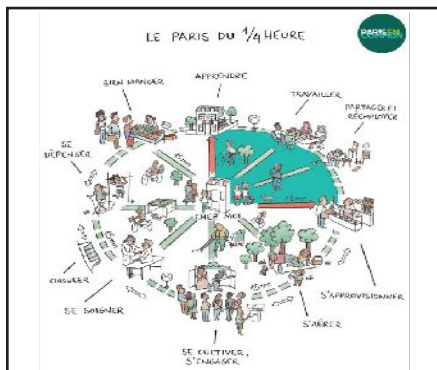
La vision "Paris du 1/4 heure"

Dans "la ville du quart d'heure", vous pouvez donc manger, vous divertir, vous soigner, vous dépenser mais aussi travailler à moins de quinze minutes de votre domicile, à pied ou à vélo évidemment. Pour que tout soit proche, Anne Hidalgo compte