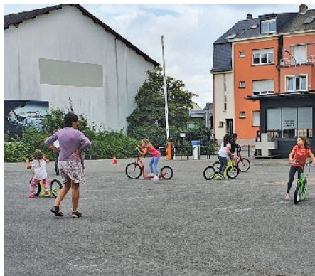
Fahrradschule im Innenhof des Carré

Im Juli fanden im Innenhof des Carré in Hollerich Fahrradkurse für Erwachsene und Kinder statt. Diese Kurse waren spezifisch gedacht für Personen, die noch gar kein Fahrrad fahren können. Es wurde nach der Philosophie des Verbandes der Radfahrlehrer moveo-ergo-sum gelehrt. Im Vergleich zu fast allen herkömmlichen Fahrradkursen wird den Teilnehmern in den von uns mitorganisierten Kursen beigebracht, dass das Radfahren sich nicht von Lehrer zu Schüler vermitteln lässt, sondern, dass es das Rad höchstpersönlich ist, welches den Lehrenden das Radfahren vermittelt. Die Kurse wurden von ausgebildeten Fahrradlehrern in vier verschiedenen Sprachen abgehalten.