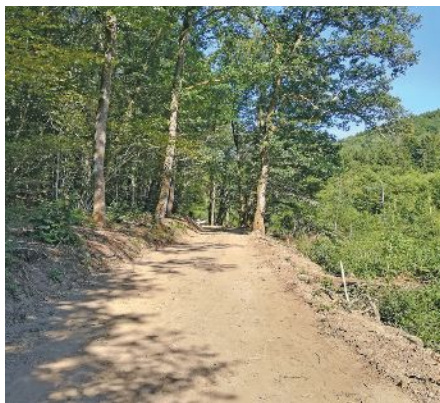
Verbreiterung des vorhandenen Wanderweges

Die entgültige Fertigstellung der PC20 wird trotz des großen neuen Teilstücks jetzt noch nicht erzielt. Noch immer klafft zwischen der bestehenden Eisenbahnlinie im Osten Wiltzs und dem auf dem ehemaligen Gleisbett ruhenden Fahrradweg im Westen Wiltzs eine unübersehbar große Lücke. Eine provisorische Schließung der Strecke über die ehemalige Industriefläche ist nicht geplant. Erst mit dem Bau des neuen Viertels „Wunne mat der Wooltz“ ist eine Fahrradverbindung vorgesehen. Ein Fertigstellungsdatum ist derweil nicht bekannt. So heißt es weiterhin sich zwischen der vielbefahrenen Hauptstraße oder der steilen Rue Neuve/Rue du Pont zu entscheiden. ProVelo arbeitet zurzeit für den Naturpark Obersauer ein Fahrradkonzept aus, unter welches auch die Stadt Wiltz fällt. Auch wenn es in dieser engen, von Hauptverkehrsachsen und steilen Straßen geprägten Stadt, nicht viele Alternativen gibt, so soll die provisorische Verbindung jedoch ausgeschildert werden und die Autofahrer, anhand von Verkehrsschildern, auf die mögliche Präsenz von Fahrradfahrern auf der Straße aufmerksam gemacht werden.