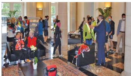
Petite collation pour les cyclistes à l'Hotel de Ville de la VdL lors de l'action "Mam Vëlo vu Miersch an d'Stad"

En effet, les détours de la piste cyclable par rapport à la route nationale N7 sont par endroits considérables et il serait souhaitable de réfléchir sur la création de liaisons plus directes et rapides, notamment pour le trafic cycliste au quotidien. Le projet de réaménagement de la N7 présenté par le ministre du Développement durable et des Infrastructures en juillet 2017 constitue un pas important dans cette direction. Un des points noirs le plus important reste pourtant la sécurisation de la PC1 au niveau des Kromm Längten à Walferdange, où d'ailleurs a récemment eu lieu un accident entre une voiture et un cycliste dans la rue de l'Eglise à Walfer. Concernant ce dernier tronçon, le MDDI vient d'intégrer un projet de mise en site propre de la piste cyclable le long des rails dans le plan directeur sectoriel «Transports».