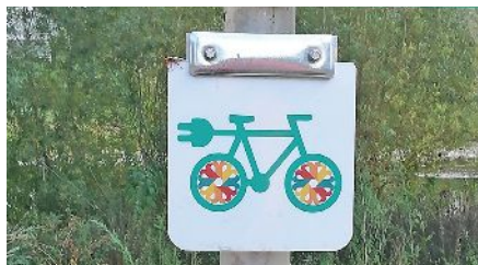
Beschilderung des Tudor Tours

Seit diesem Sommer kann man die alternative Stromproduktion in Luxemburg auf dem E-Bike oder auf dem Tourenrad erkunden. Der lokale Radrundweg führt am interaktiven Tudormuseum für Strom und Akkumulatoren vorbei und verbindet alle pittoresken Dörfer der Gemeinde Rosport-Mompach mit der Abteistadt Echternach, die als erste Stadt Luxemburgs mit einer elektrischen Beleuchtung ausgestattet wurde. Von Echternach aus startend, geht es durch das grüne Sauerland an Steinheim vorbei bis nach Rosport, bevor es dann hoch aufs Plateau geht, wo man wunderschöne Aussichten genießen kann. Die Tudor Tour ist in beide Richtungen beschildert und verläuft zum Teil auf den nationalen Fahrradwegen PC2 und PC3. Mit seinen knapp 50km und seinen 1052 Höhenmetern eignet sich die Tour vorallem für Elektro-Bikes, die Strecke ist aber auch