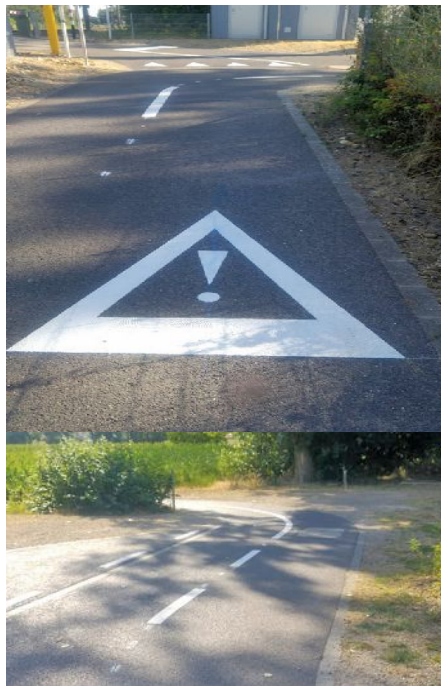
Sécherheitsmesuren op der PC15

Op der Vëlospist tëscht der Stad a Miersch sinn op zwou Plaze Sécherheitsmesuren agefouert ginn, déi d'Vëlosfuere méi sécher solle gestalten. Duerch e grouse Piktogramm mat engem Ausruffzeechen um Buedem gëtt de Vëlosfuerer op déi schaarf Kéier virgewart. Och eng Fuerbunnamarkéierung ass opgemoolt gi fir de Vëlosfuerer méi sécher duerch d'Kéier ze leeden an eng Kollisioun mam Géigeverkéier ze vermeiden. Eng Mesure déi och op anere Vëlospistë vu Notze wär.