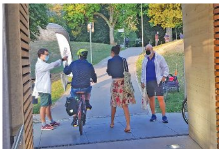
Verteilung der Beutel am Ausgang Panoramalift

Ganz in der Tradition, hat auch die diesjährige Mobilitätswoche mit dem vom Verkéiersverbond, der Stadt Luxemburg und uns organisiertem "E Kaddo fir de Vëlo" angefangen. An vier verschiedenen Stellen in Luxemburg Stadt wurden Jutebeutel an Radfahrer ausgeteilt, in denen kleine Gadgets und Informationsmaterial rund um das Fahrrad enthalten waren. Ziel der Aktion ist es, den Personen zu danken, die für ihren Arbeitsweg auf ihr Auto verzichten und sich mit dem Fahrrad in die Stadt begeben.