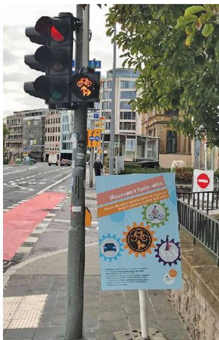
Feux-vélo orange clignotants sur le Boulevard F.D. Roosevelt, rue Philippe II

«Grâce à cette signalisation spécifique, les cyclistes bénéficient désormais de déplacements plus fluides en réduisant le nombre d'arrêts aux feux de circulation», précise la Ville. Après les six mois, un bilan sera dressé, qui se rapporte aux conclusions afférentes concernant aussi bien les cyclistes que tous les autres usagers de la route concernés par le présent projet-pilote.