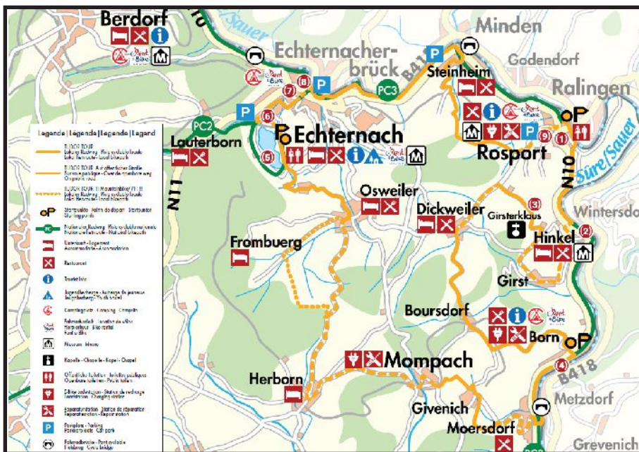
Übersichtskarte der Tudor Tour mit allen nützlichen Informationen

ohne Bedenken mit einem Tourenrad zu befahren. Entlang der Strecken sind zahlreiche Restaurants, Unterkünfte sowie Sehenswürdigkeiten zu finden. Zudem sind in Echternach, Rosport, Born und Mompach Servicestationen eingerichtet worden, wo man sein E-bike problemlos laden kann und kleine Reparaturen am Rad gemacht werden können. Als Startpunkte bieten sich vorallem die "Rent A Bike" Stationen in Rosport, Born und Echternach an. Weiter Informationen finden Sie u.a. auf der Homepage vom ORT Müllerthal.