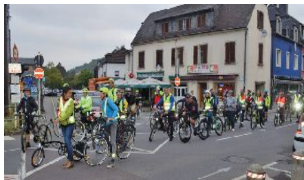
Les cyclistes à Dommeldange

Pour promouvoir le vélo comme moyen de transport au quotidien, même sur des distances un peu plus importantes (>20 km), ProVelo avait invité, dans le cadre de la semaine européenne de la mobilité, à parcourir le trajet de la gare de Mersch jusqu'à la place Guillaume au centre de la ville de Luxembourg.